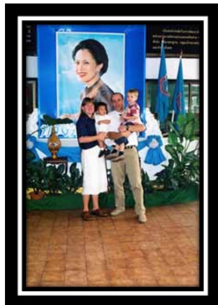
Le jour de mon adoption en 2004. Nous sommes photographiés devant le portrait de la reine Sirikit Kitiyakara.