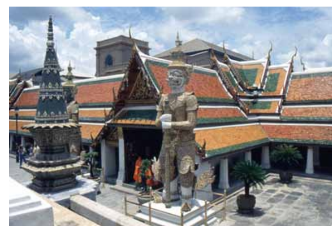
Notre arrivée à Bangkok et la visite du palais royal