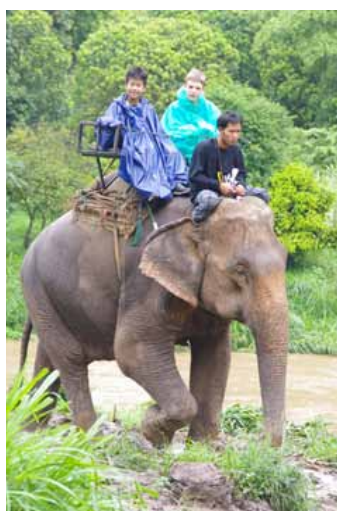
Balade en éléphant ...