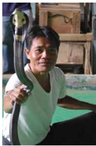
et visite d'une ferme de serpents !

Je suis heureux d'avoir fait ce voyage avec ma famille.