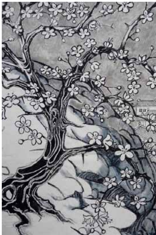
Tenture d'Olivier OTT

Bravo à tous les acteurs, à Mme Beyeler (metteur en scène) et toutes les personnes qui ont contribué au spectacle !